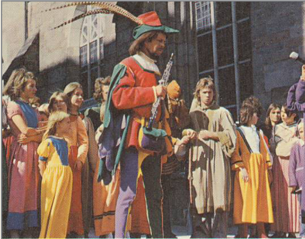
325 Hameln an der Weser Wer einmal hier war, kommt immer wieder Im Sommer sonntags Rattenfänger-Freilichtspiele

Bei den Karten der Bundesrepublik Deutschland kann man sich zumindest bei den Karten Hamelns nicht sicher sein, ob die Bilder nicht bewußt seitenverkehrt montiert wurden, um Eintönigkeit vorzubeugen. Bei der Karte ... kann man das vermutlich ausschließen.