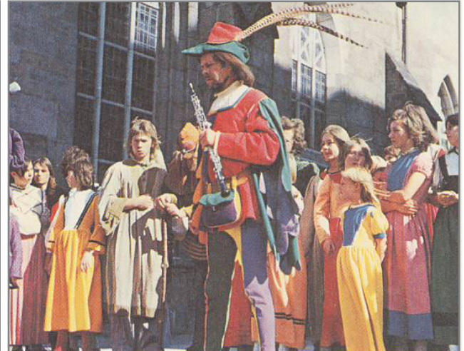
3250 Hameln an der Weser Wer einmal hier war, kommt immer wieder Im Sommer sonntags Rattenfänger-Freilichtspiele

#46-4066 und #51-5019; mit Emblem: #69-4175