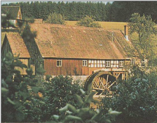
7244 Waldachtal im Nördlichen Schwarzwald Die alte Sägmühle – noch in Betrieb – ist eine Sehenswürdigkeit des Luftkurorts Waldachtal-Lützenhardt (550–650 m) bei Freudenstadt. Auskunft über (0 74 43) 60 73

H 69-4171, H 69-5175, H 69-6147, H 69-7097, H 69-8172