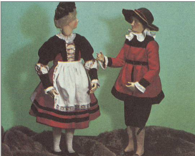
8632 Neustadt b Coburg Besucht das Trachtenpuppenmuseum der bayer. Puppenstadt Neustadt