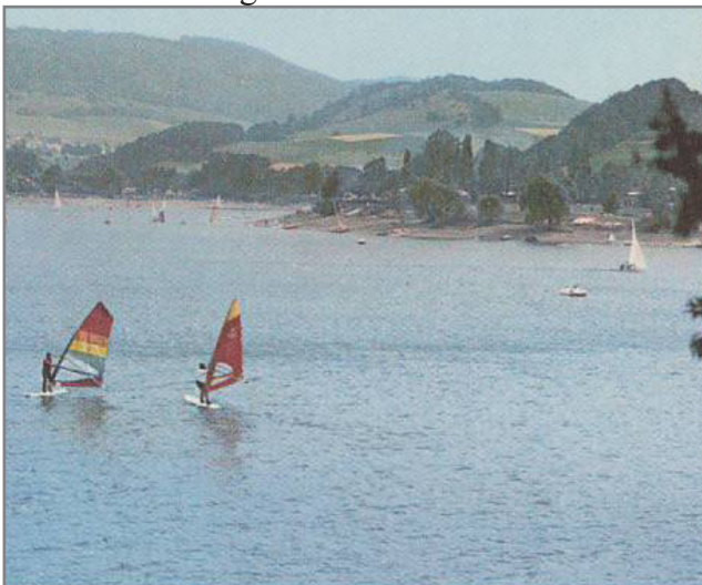
Diemelsee (350–780 ü. NN) im Herzen des Naturparks, Ferienland Waldeck Luftkur- und Erholungsorte, Freizeitmöglichkeiten aller Art Verkehrsamt, Postfach 1 00, 3543 Diemelsee

leichte Ausschnittvergrößerung und Verschiebung