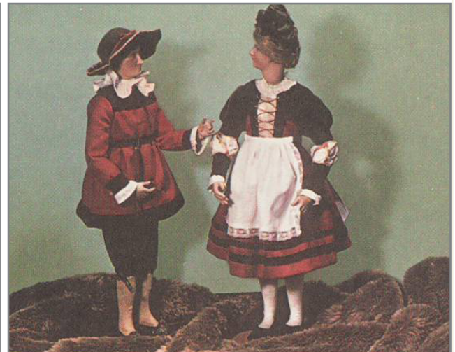
8632 Neustadt b Coburg „Bayer. Puppenstadt“ im „Herzogtum Coburg“ Puppenpärchen aus dem Trachtenpuppenmuseum