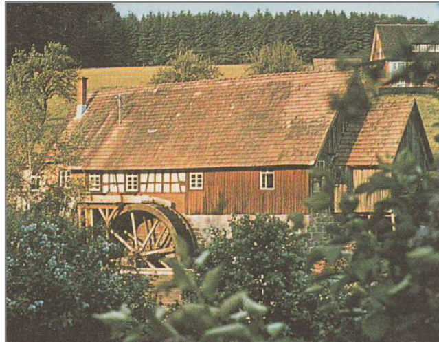
7244 Waldachtal im Nördlichen Schwarzwald Die alte Sägmühle – noch in Betrieb – ist eine Sehenswürdigkeit des Luftkurorts Waldachtal-Lützenhardt (550–650 m) bei Freudenstadt. Auskunft über (0 74 43) 60 73

H 69-4171, H 69-5175, H 69-6147, H 69-7097, H 69-8172